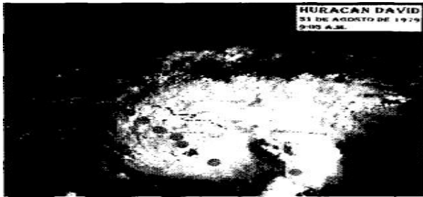
IMAGEN DEL HURACÁN DAVID EN EL MOMENTO EN QUE CAMBIA DE DIRECCIÓN MÁS AL NORTE, PARA INICIAR DESPUÉS DEL MEDIO DÍA SU ENTRADA A TERRITORIO DOMINICANO SOBRE LAS COSTAS DE LA PROVINCIA DE SAN CRISTÓBAL.