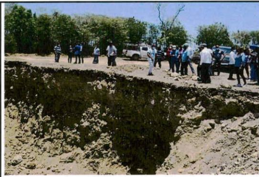
Imágen del lugar dedonde se extraen materiales de construcción.