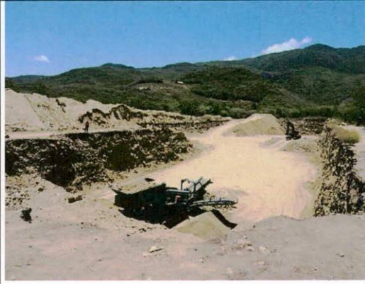
Imágenes de la mina de extracción de materiales de construcción.