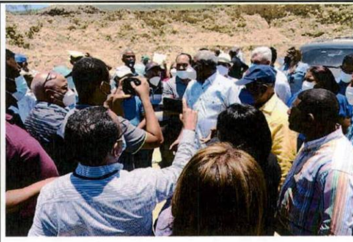
Imágenes donde se observa a comunitarios del municipio Villa González que participaron en la actividad y a diputados(as) de la Comisión de Medioambiente que asistieron al traslado.

En tal sentido, la comisión pudo comprobar el deterioro ecológico que está causando la extracción de materiales de construcción en los terrenos explotados por las minas, y en consecuencia, el daño que ocasiona a la salud de sus habitantes y a la agricultura, así como al medioambiente. Por lo que, decidió presentar al Pleno de la Cámara de Diputados un informe de investigación mediante el cual recomienda la elaboración de un proyecto de resolución que solicite a las autoridades del Ministerio de Medio Ambiente y Recursos Naturales, tomar las medidas necesarias a fin de solucionar los problemas de salud y medioambientales que padecen los habitantes del municipio Villa González, provincia Santiago, y algunas comunidades aledañas.