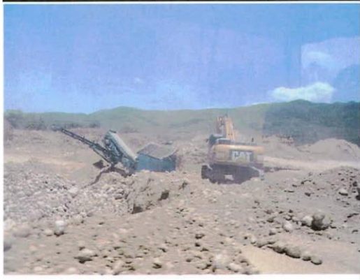
Imágenes de mina de extracción de materiales de de construcción.

ACTA NO. 03 DEL MARTES TREINTA (30) DE AGOSTO DE 2022, PÁGINA NO. 114 DE 170